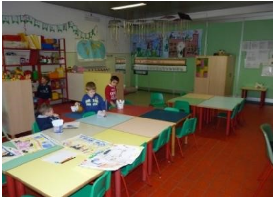
AULA Cornaro 1