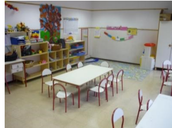
AULA Cornaro 2