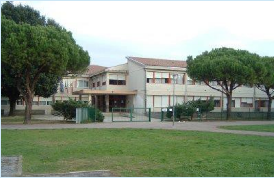
P L E S S O F U C I N I