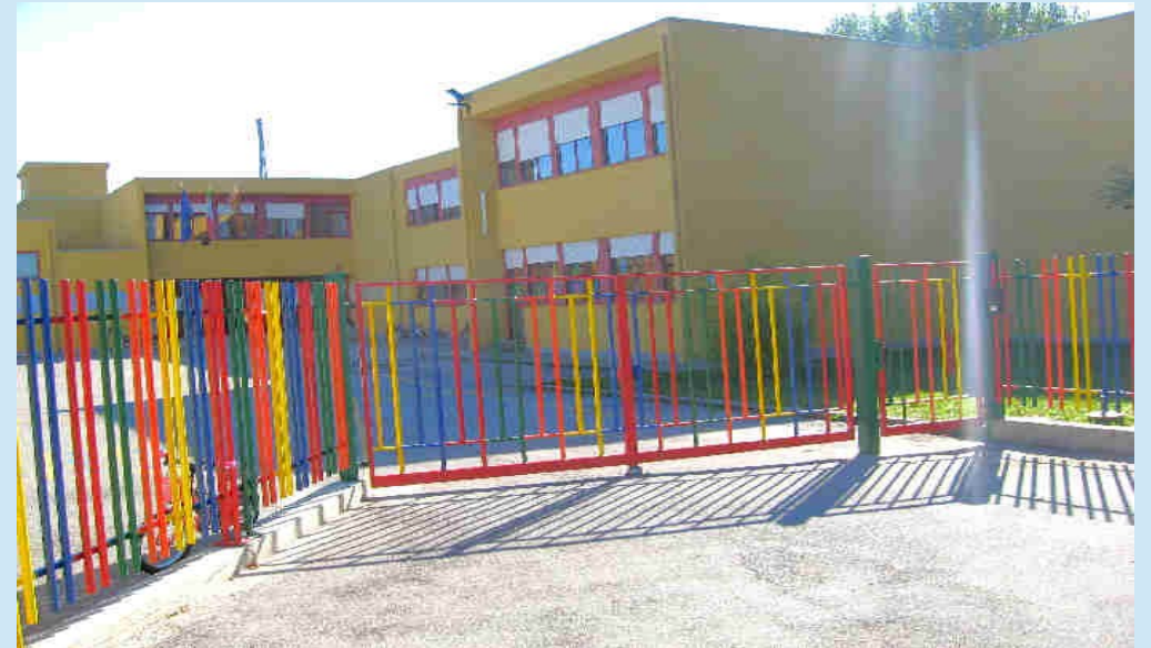
P L E S S O V A L E R I

14 dicembre 2020 RIUNIONE ISCRIZIONI A.S. 2021/22