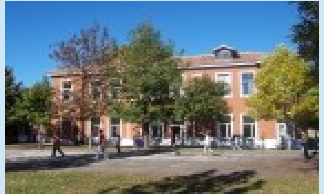
P L E S S O M A M E L I