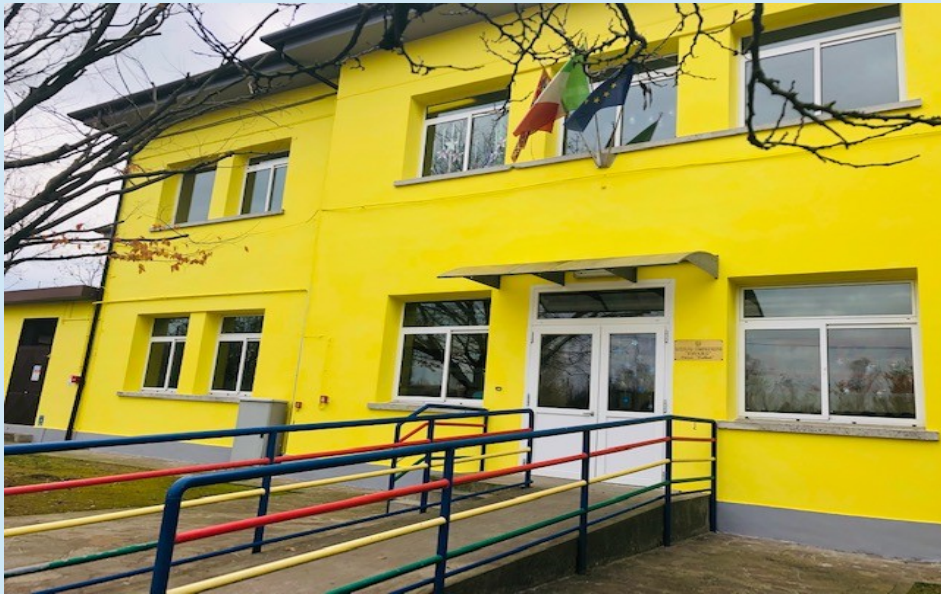
P L E S S O C O L L O D I